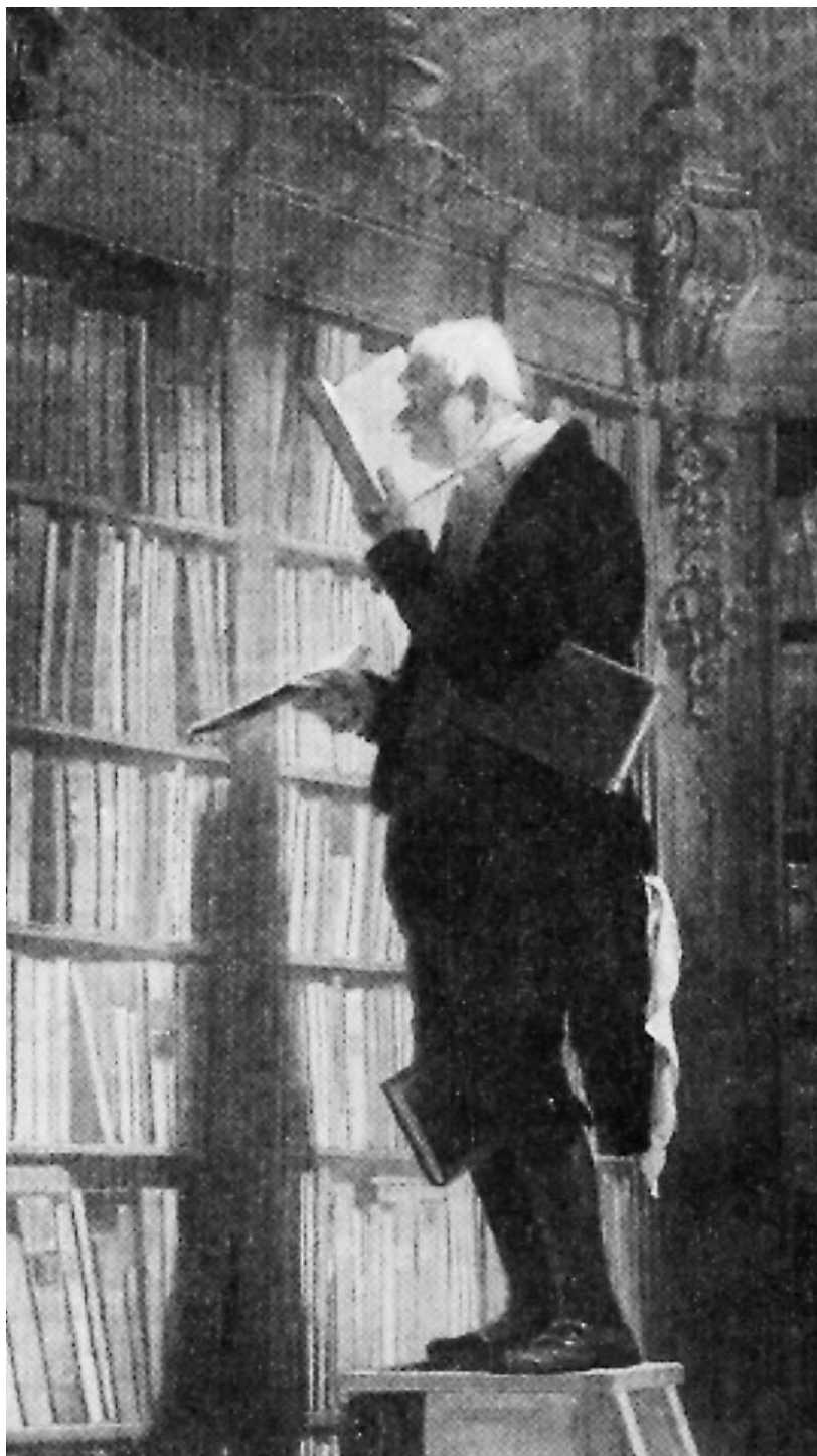
Der «Bücherwurm» von Carl Spitzweg

zeichnet. In der Landschaft Hasli das Wyssland in Meiringen, in Münster im Jura ebenfalls, heute, falsch verstanden, als «Terre Blanche», oder hier bei uns im Saanenland, Wysseny. Daraus entstand das welsche «Gessenay», weil nur die Deutschen unter den nämlichen Grafen von Greyerz das Recht zur Volksversammlung hatten, die Welschen dagegen nicht. Kein Ort/Weiler im Saanenland hat denn auch einen französischen Namen, «Gessenay» ist unbestimmt, dagegen kennt man auch heute