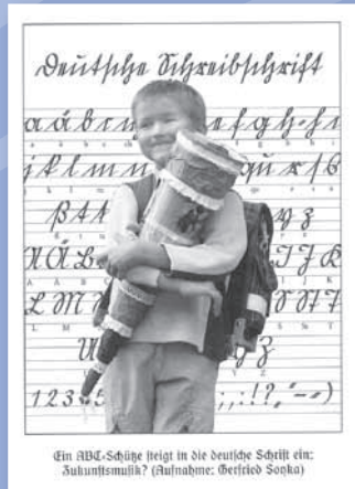
Ein ABC-Schöne trägt in die deutsche Schrift ein: Suhntismulki?